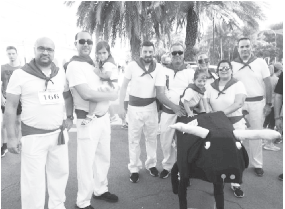
Año 2022. Suelta de Vaquillas.