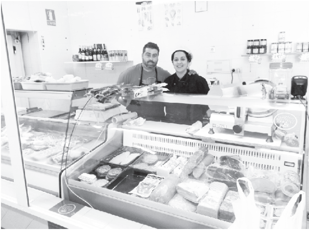
Año 2023. Carnicería El Bolo - Estación Linares Baeza.