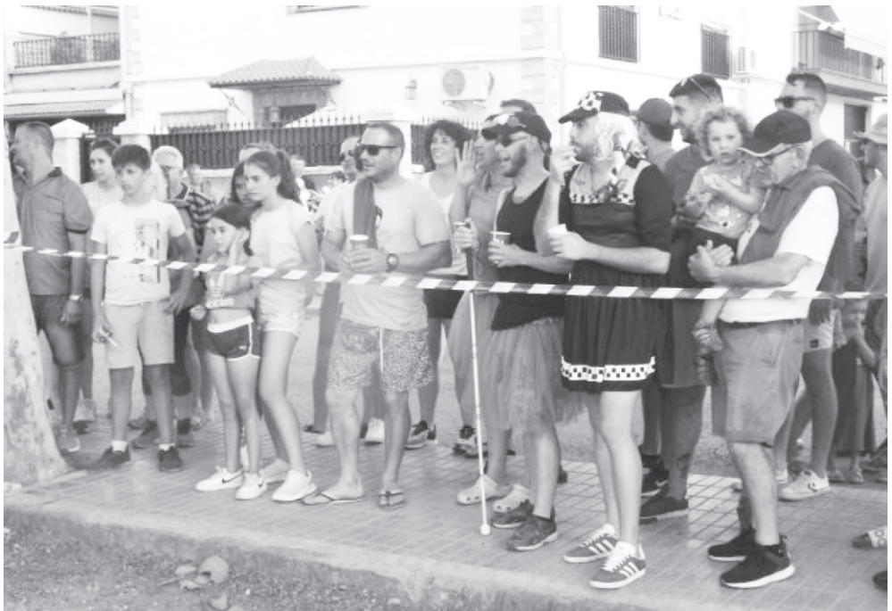
02/07/2022. De Cuañas.