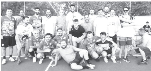
Año 2022. Viejas Glorias.

Patrocina: Excmo. Ayuntamiento Estación Linares Baeza.