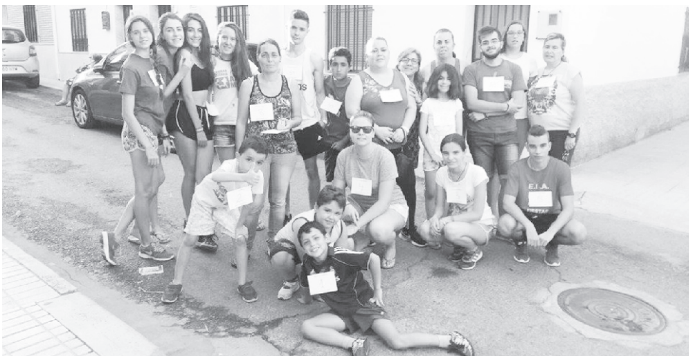
Año 2016. Fiesta Virgen del Carmen.