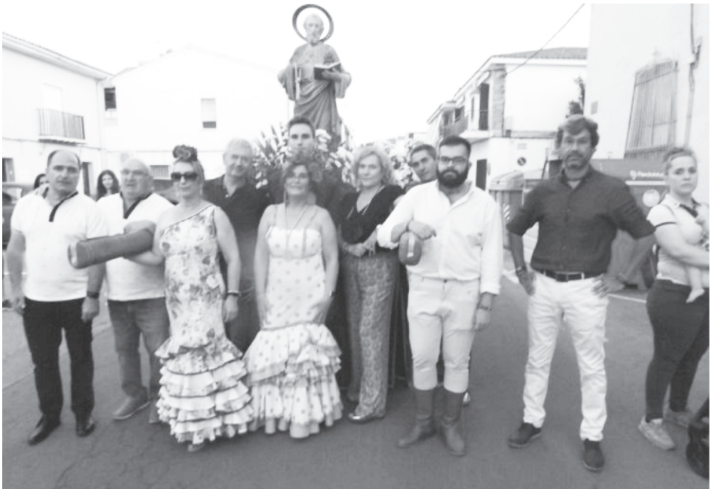
03/07/2022. Procesión de San Pedro.