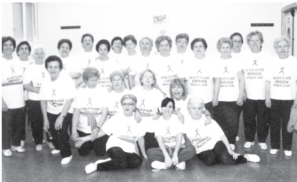
Año 2008. Gimnasia de Mayores.