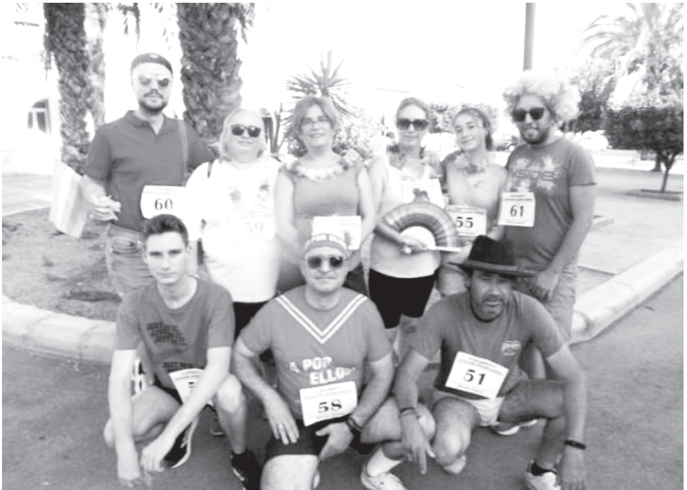
02/07/2022. Familia Murillo, esperando la salida del Maratón.