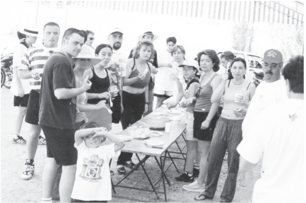
Año 2000. En Feria.