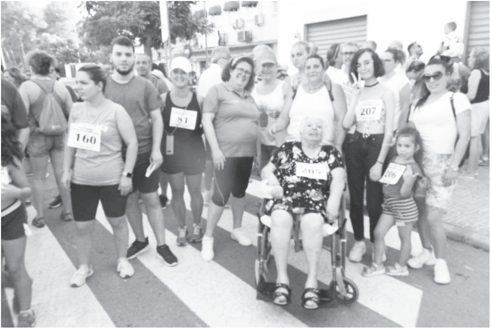
02/07/2022. Salida del Maratón.