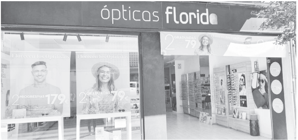
Año 2023. Ópticas Florida - Linares.