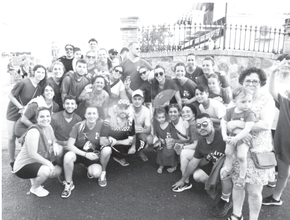
02/07/2022. De Fiesta.