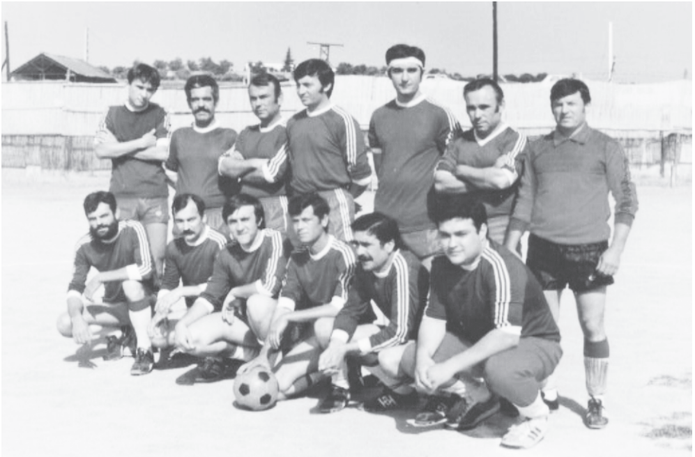
Año 1982. Equipo de Fútbol de Forestales.