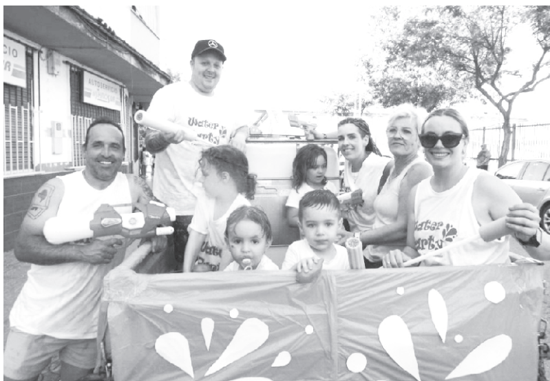
Tarde del Agua.

Amenizada por la Orquesta “TORREBLANCA SHOW” .