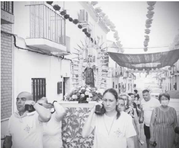
Año 2022. Procesión de la Virgen del Carmen.