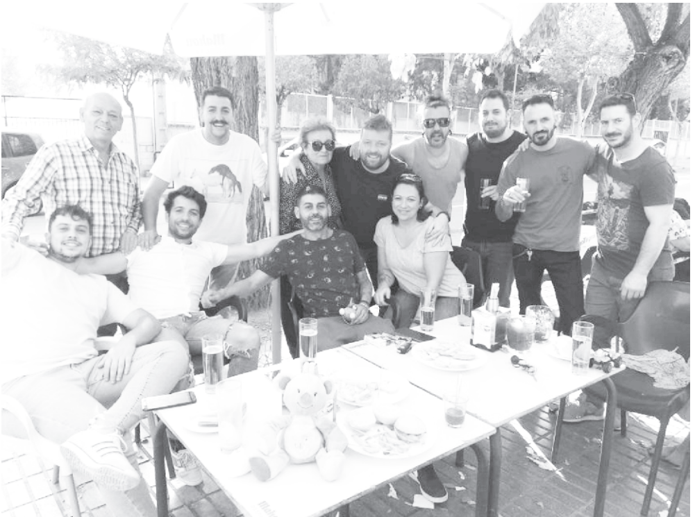
Año 2022. Reunión de Vecinos.