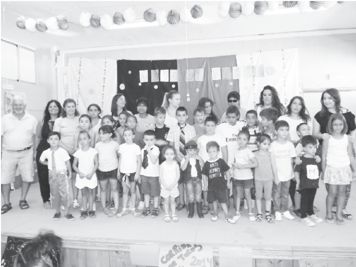
14/08/2014. Escuela de Verano.